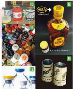
久金属工業(北津守)西成区北津守1丁目

事業が軌道にのり、やがて関 西ペイントの骨料街を手がける にあたり、小田町の工場では 手狭になり、1934年に北津 守に移転しました。築80年の洋 館(本社)の心鏡室には昭和の 趣が残っています。