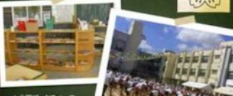
▲広場アツクスペース

創立143年!! 友達班 ハッピータイム 勝間南瓜や田辺大根 ヒートアップ 読書スポットと図書室 パソコン室 玉小フェスタ 幼小交流 オリエンテーリング