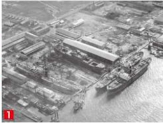
1953年頃、南津守のサノヤス造船所。大型貨物船「第五満鉄丸」を建造中。工場周辺は湿地でした。