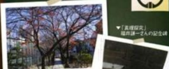
▼「高津原」 稲井謙一さんの記念碑

さそやきの小径 アスレチック ノーベル化学賞の稲井謙一さんが卒業生 私服 100周年 岸里まつり 1/2成人式 校庭キャンプ