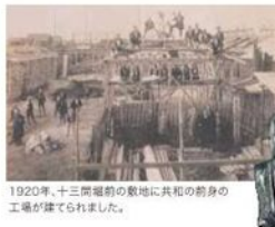
1920年、十三間堀前敷地に共和の前身の工場が建てられました。