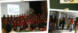
▲地盤合同防災避難訓練

運動場が広い プールが2つある 外にもバスケゴールがある 図書室 90周年記念式典(平成27年11月) 北津守子どもカーニバル 1泊移住