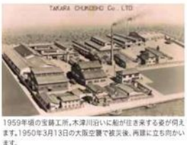
1950年頃の宝飾工場。木津川沿いに船が往来する姿が伺えます。1950年3月13日の大爆空襲で被災後、両隣に立ち向かっています。

1921年に北津守で紡物工場 として創業。17年まで、麻や 五徳などの日用品飾物が主力製品 でした。 やがて即美容椅子分野に進出 し、世界初の電動理容椅子を開発。 椅子のシヤアは日本「1」シヤア 機器や化粧品品の製造、空間設計も 手がけています。また、医療分野でも も歯科用の「チェアユニット」の輸出台 数は日本一。 1956年にニューヨークに現 地法人を設立し、海外事務所は現 在23か所とつなっています。