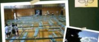
▲橘まつの巨大迷路

給食がおいしい 遊具がいっぱい運動場 夏の水遊び グリーン広場 パソコン室 図書室 林間 たちはなまつり 93周年 百人一首大会 校庭キャンプ 1/2成人式