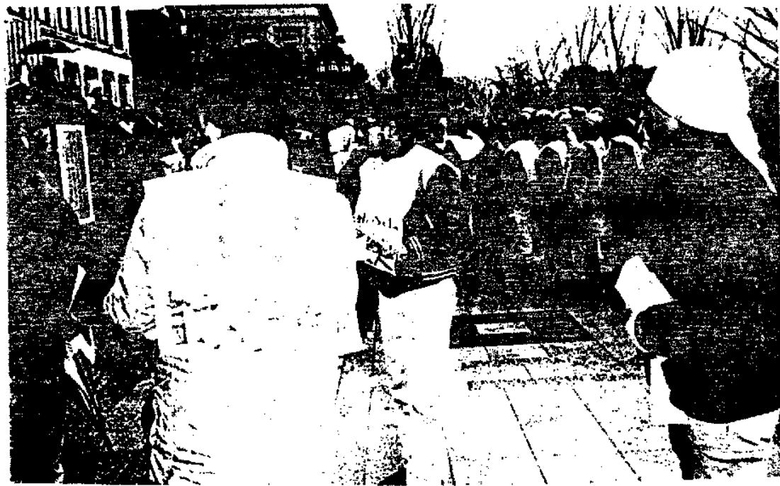
1月4日 府庁前抗議行動の状況