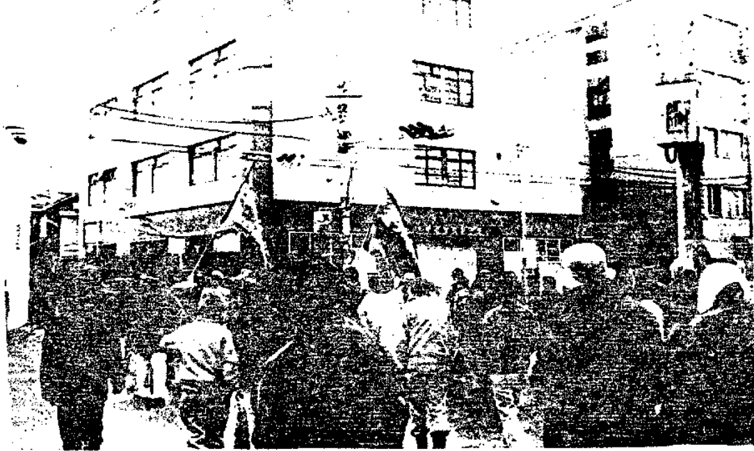
昨日 既泊沖に決起する仲間たち(午後前)