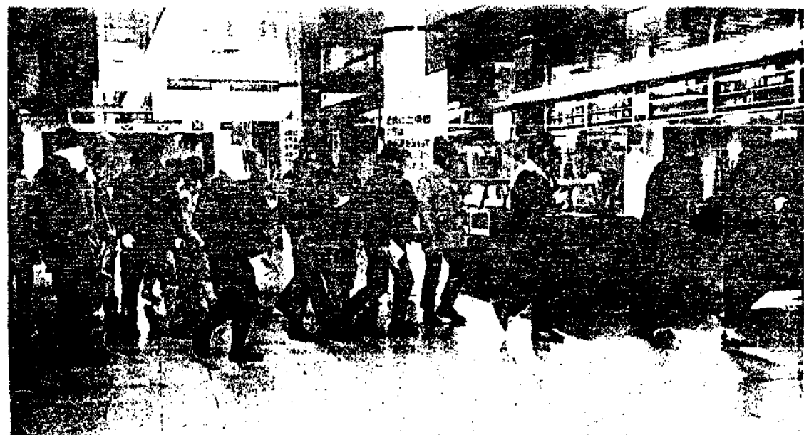
1月2日 京都駅における越冬パトロール、及び 情直活動

京都市民の皆さん、 私たちは昨年の12月21日から、大阪の巨福野行書野垂れ死の責任をとり、一人の死者を出さない仲間の命を仲間の力で守るために、12月16日の怒りの闘争を行いました。 さて、今年は京都においても、青カニする仲間の命を守るために、怒りが結成され、12月20日から市内の医療パトロールなど闘争を行っています。 怒りの闘争は、中曽根政権の行方、福祉切り捨て、野垂れ死の再発防止、一十名を怒る仲間がアオカニを余儀なくされ、市内全域、さらには兵庫、京都へと拡散されていきます。 しかし、大阪府は、今回の野垂れ死時指所を大幅に削減し、アオカニ野垂れ死に拍車をかけています。さらに大阪府警は、臨泊切り捨てに抗