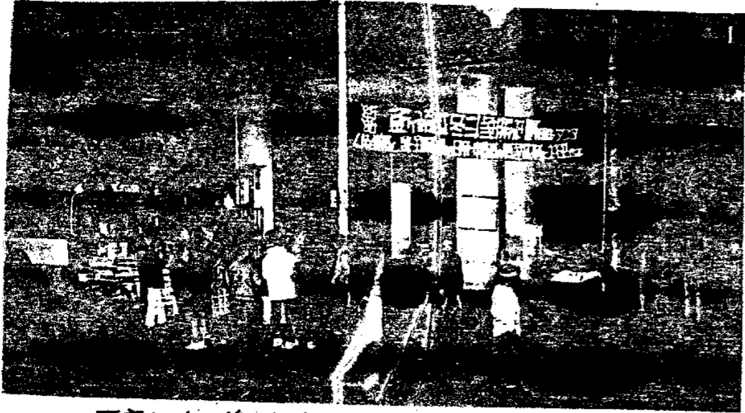
医療センター前 拠点