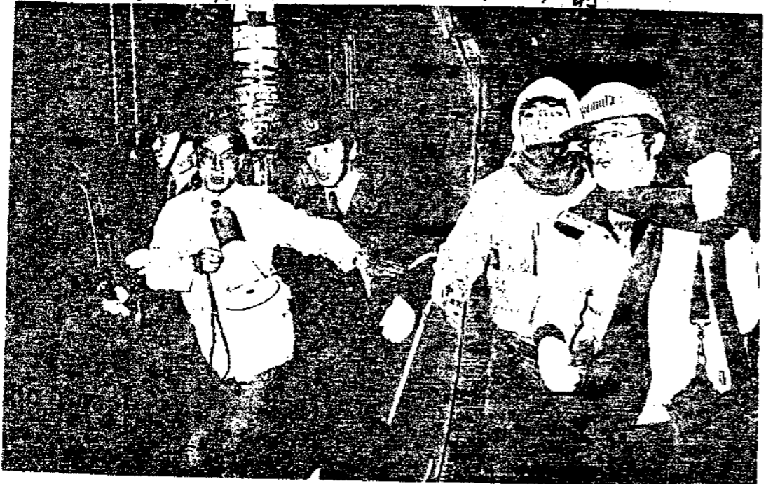
機動隊と攻防しながら 三角公園から医療センター前