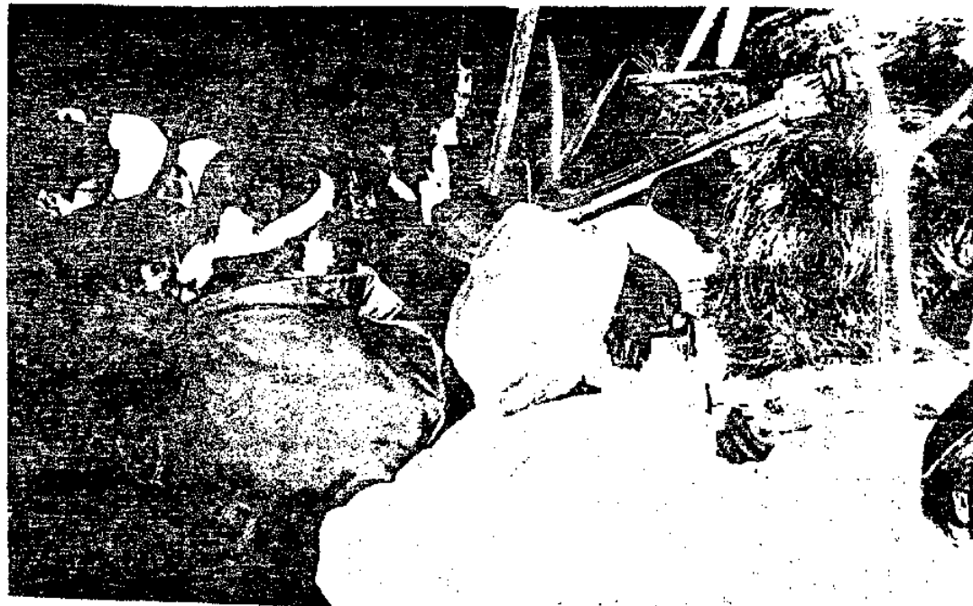
12月25日 三角公園→医療センターへ移動中、機動隊との攻防戦