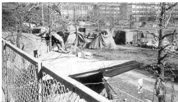
▲西成公園のテント（冊子・「西成の部落解放運動」から）

反失連は、そのようなことが現実のものとならないよう、実効性のある対策を求めて、要求活動を続けていきます。