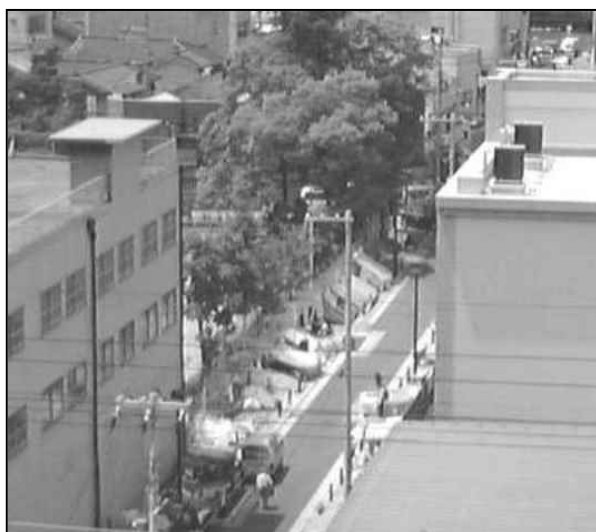
▲強制排除前の今宮中学南側道路の様子。右が中学校校舎。左の木が見えるところは野宿生活者が移動した公園

大阪市のことばかり言いますが、大阪府の「野宿労働者対策」は、センターのシャッターを開けることと、10 名の就労枠の提供しかない、という問題があります。