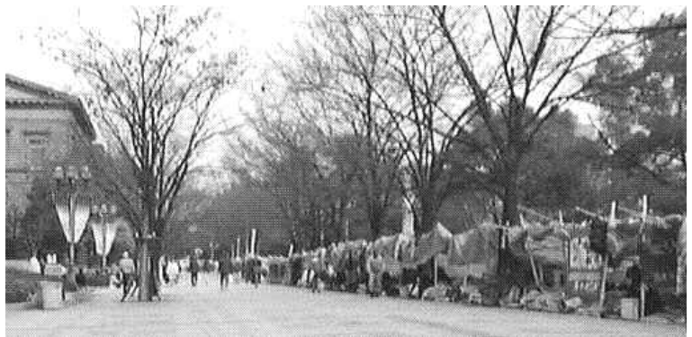
▲1999年3月1日から30日まで、大阪市庁での野営闘争