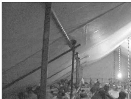
▲大テント2階の様子

私たちが求めるものとの、質的量的隔たりは大きいのですが、からかひや襲撃のない、とりあえず安