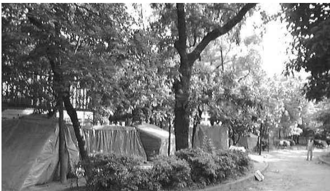
▲扇町公園のテント村。98年6月

これは、釜ヶ崎反失業連絡会や野宿者と釜ヶ崎労働者の人権を守る会のホームページを見た方から寄せられたEメールです。名前も書かれており、一市民としての困惑がまじめな形で示されていると思います。