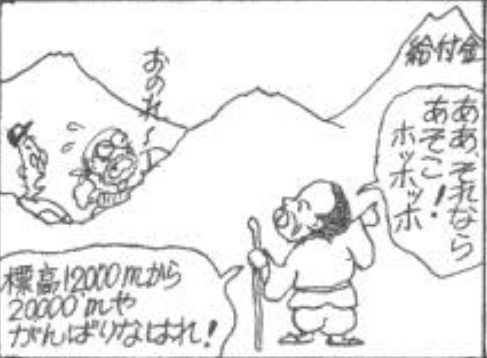
▲西成労働福祉センター センターだより 第408号掲載

が つ に ち あ さ ひ し ん ぶ ん ち ょ う かん き ゅ う ふ き ん し き ゅ う お く お お さ か し し ゃ 6月5日の朝日新聞朝刊に、「給付金支給遅れ/大阪市が謝 ざい たい は ん こ ん げ つ ち ゅ う ふ り こ き じ 罪/大半今月中振込み」の記事がありました。