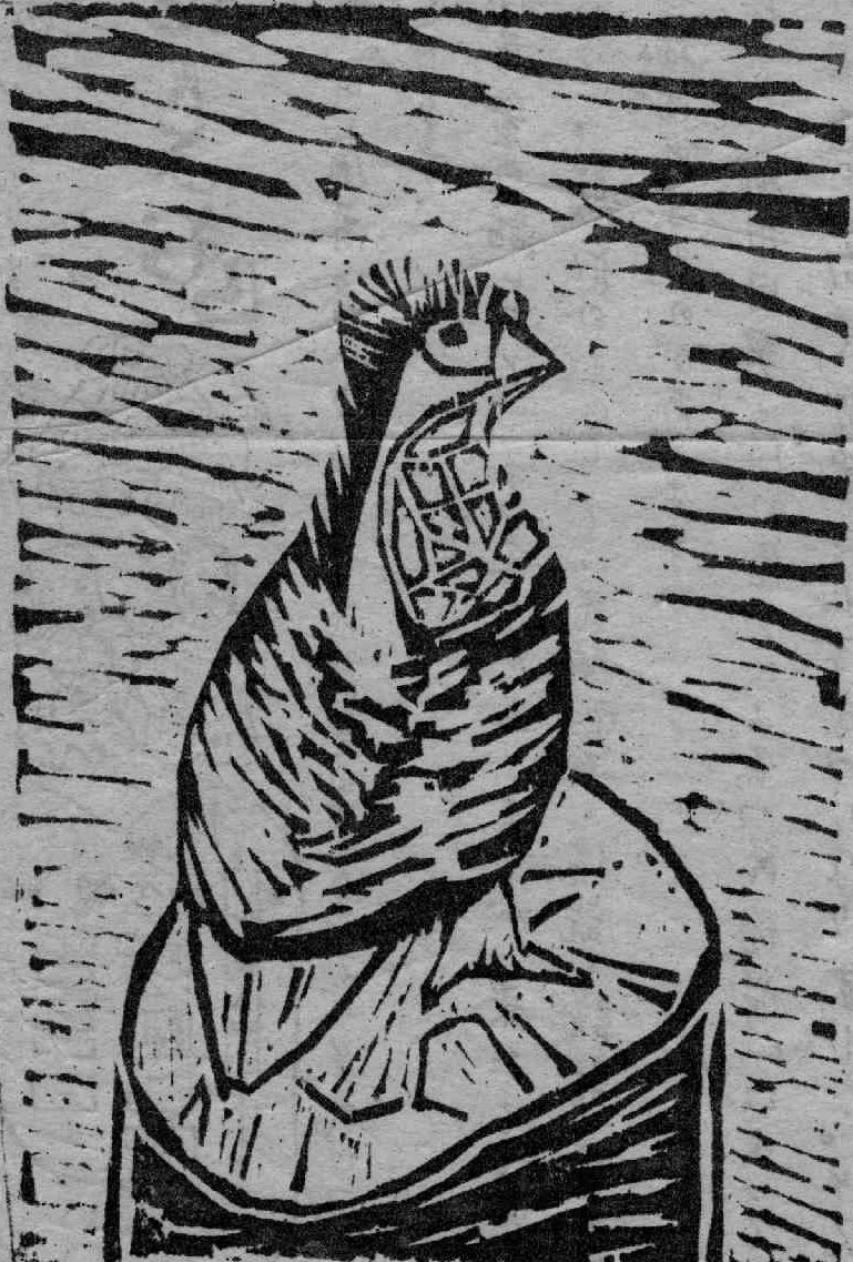
（ヤジ馬さんの 版画の作品）