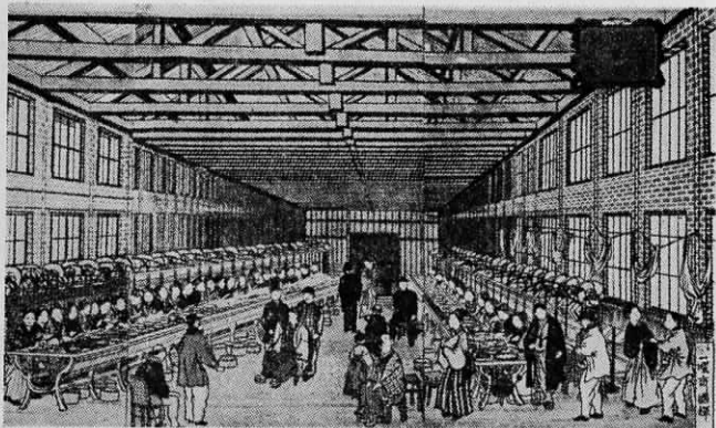
富岡製糸場 (明治5年設立、官營)

戦勝と 物価高 年代史的にいえば、明治は日清、日露の二度の戦争を体験した時代であった。二七